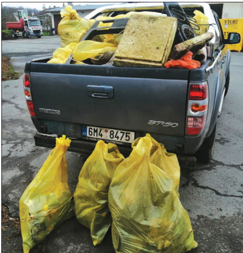
Foto č. 1 – zachycuje pouze zlomek toho, co vše se válelo volně pohozené v přírodě – foto zaslali členové Mysliveckého sdružení Bouzov.