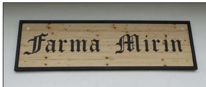
Cedule Farma Mirin Podolí tvrz