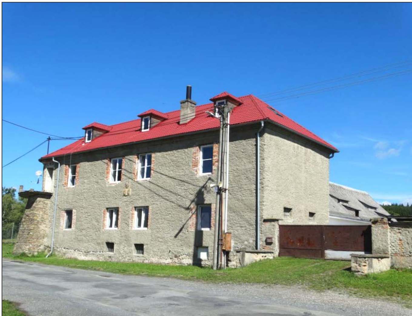
Podolí – turz před rekonstrukci