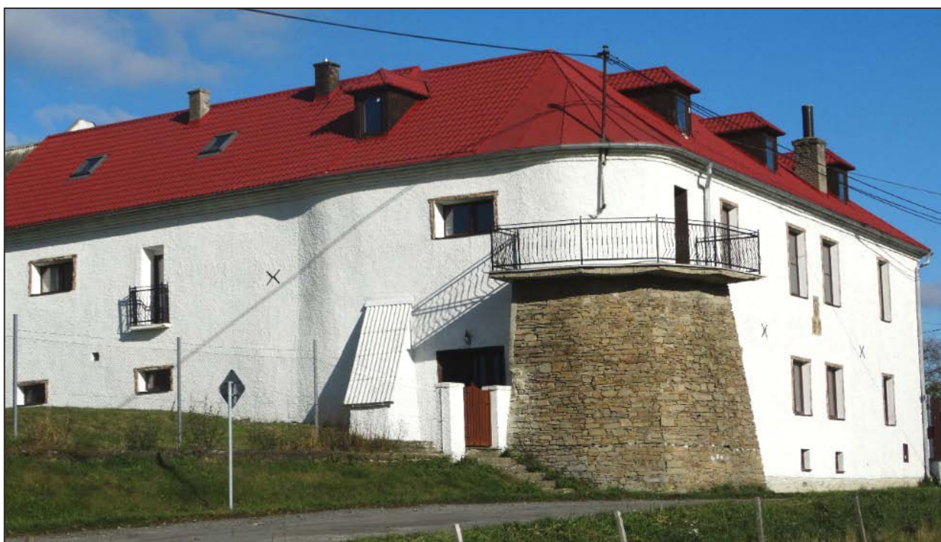
Podolí – turz