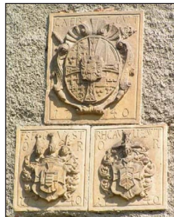
Dům č. p. 21 – Podolí tvrz