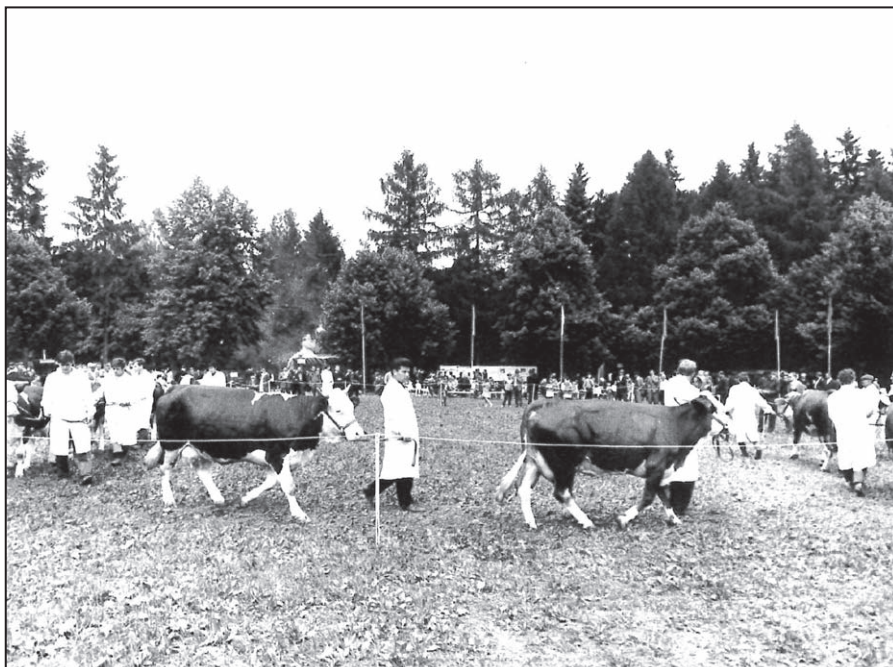
Skupina dojnic z Bouzova