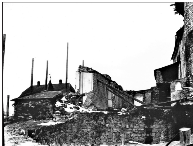
Oppersdorfský palác v době přestavby

Další etapa přestavby hradu, která byla zahájena v roce 1897 a pokračovala až do roku následujícího, se týkala Oppersdorfského křídla s baštou Búzovkou, které vidíme z druhého hradního mostu vpravo od vstupu do hradu. Také toto křídlo bylo až do základu strženo, neboť nosné trámy byly shnilé a hrozilo jejich zřícení, a palác byl rovněž nově postaven na půdorysu původní stavby. Vzhledem k tomu, že jeho okna byla obrácena k jihovýchodu a šlo tedy o prosluněné místnosti, bylo s touto částí hradu počítáno jako s letním sídlem arcivévody Evžena. Do obnovené bašty Búzovky byla umístěna ložnice arcivévody, dále pak poblíž velmistra pracovna a pokoje jeho pobočníka a komorníka. Sluneční hodiny, které můžeme vidět na zdi paláce z druhého hradního mostu, sem byly přeneseny z původní stavby.