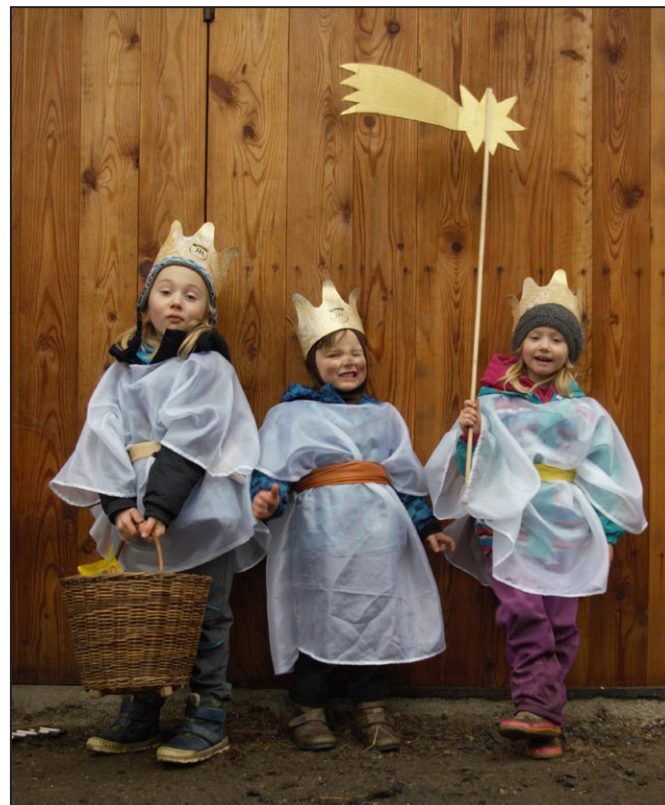
Tříkrálová sbírka v Jeřmani - děti z lesní školky - Lesního klubu Mloček ve Věžnickém údolí