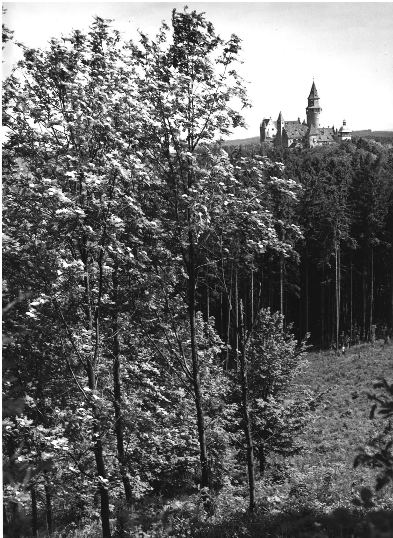
„Hrad z Bakule“

Bouzovské noviny č. 1/2018 • Periodický tisk územního samosprávného celku obce Bouzov • Vychází 21. 2. 2018