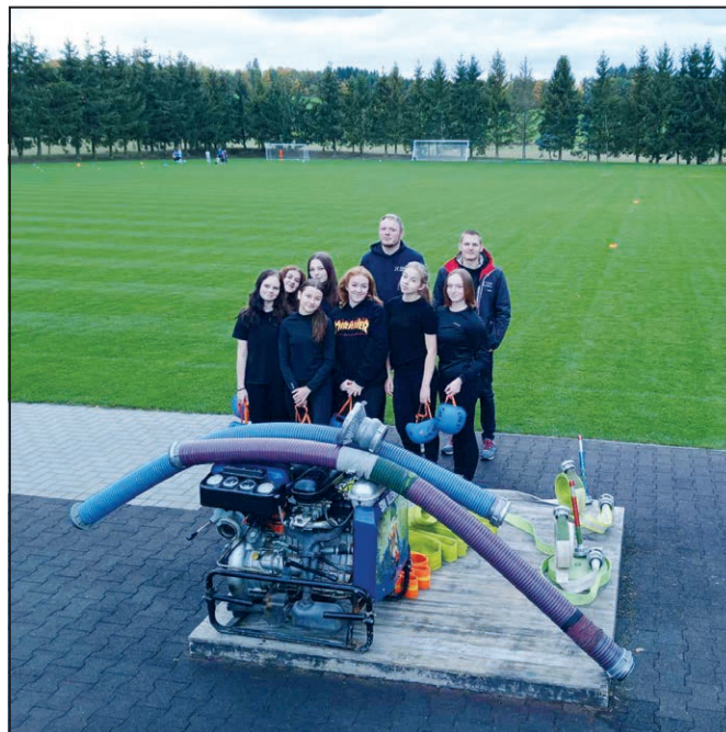
Nový tým Olešnice – ženy