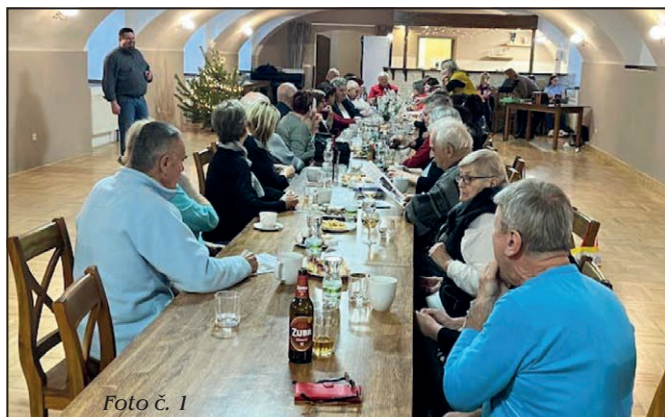
Foto č. 1