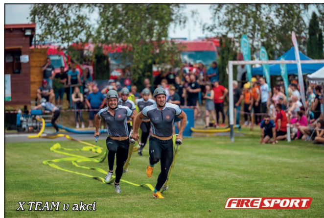
X TEAM v akci

Každý, kdo dělá nějaký sport s vášní a vytrvá, tak výsledky přijdou a X Team je toho jasným důkazem. Borci se pro letošek opět vrhli bezhlavě do Extraligy České republiky, což je u nás nejvyšší liga v požárním útoku. Po loňském celkovém 15. místě, měli jasný cíl, a to urvat vytoženou TOPI0. Špičkové sezóně snad jen překáželo jarní zranění proudaře, což naštěstí hbitě vyřešili náhradníkem, který se rychle přizpůsobil nastavenému tempu. Že se jedná o nelehký úkol, jasně dokazuje fakt, kdy na Extralize ČR v požárním útoku spolu soupeří i týmy, ve kterých figurují kvalitní čeští atleti, kteří propadli kouzlu tohoto sportu. Asi Vám nemusíme připomínat, že požární útok je postaven převážně na rychlosti, takže si dovede představit, jak se za ty roky dokázal místní tým atleticky vypracovat.