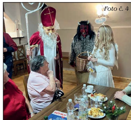
Foto č. 4

Pozn.: Foto č. 1 až 4 zachycují průběh společenského posezení